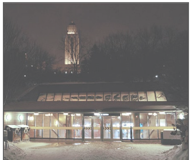
Université-de-Montréal Metro. Photo par Chicoutimi, 2010.

L'émission d'alertes de froid extrême déclenche une réaction au sein des collectivités locales. À Montréal, la Société de transport de Montréal permet aux sans-abri de se réchauffer dans les ter-