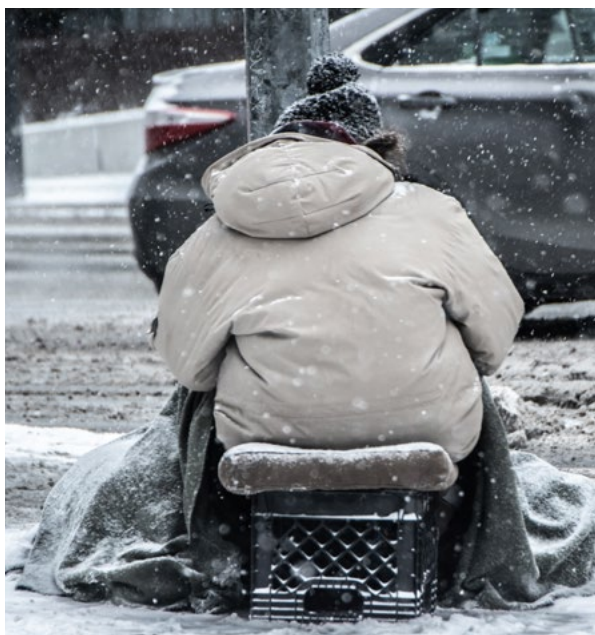
Un homme sans abri dehors par temps extrêmement froid.

Les risques accrus que représentent les changements climatiques pour la santé des Canadiens inquiètent de plus en plus tous les ordres de gouvernement (Berry, 2014). Les villes s'attendent à ce que les changements climatiques compromettent gravement les infrastructures de soins de santé publics lorsque les services essentiels seront interrompus par des conditions météorologiques extrêmes (Watts, 2018). Les représentants de la santé publique à l'échelle municipale et régionale sont préoccupés par la façon dont les change-