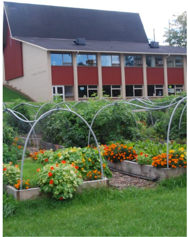
Jardin communautaire, Dundas, Ontario.

Les collectivités évaluent les répercussions des changements climatiques sur les systèmes alimentaires en examinant et en élaborant des politiques de production et de distribution qui appuient l'agriculture locale. Par exemple, le plan d'action régional pour les systèmes alimentaires de Metro Vancouver comprend des mesures visant à mieux comprendre et à réduire les risques pour les terres de production alimentaire et le secteur agricole de la région, y compris l'expansion du secteur alimentaire local. Les activités d'agriculture urbaine prévoient entre autres une meilleure accessibilité