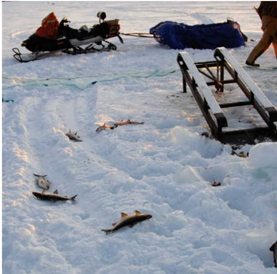
Pêche sur glace sur le fleuve Churchill.

besoins de leur communauté et à déterminer les moyens de consolider leurs actifs et leurs capacités. Pour une meilleure sensibilisation du public aux risques liés au climat et aux pratiques de préparation aux catastrophes, il faut établir des partenariats solides avec les organismes communautaires qui œuvrent auprès des populations vulnérables pour que la ville soit plus en santé et plus sécuritaire (Centre climatique des Prairies, 2017).