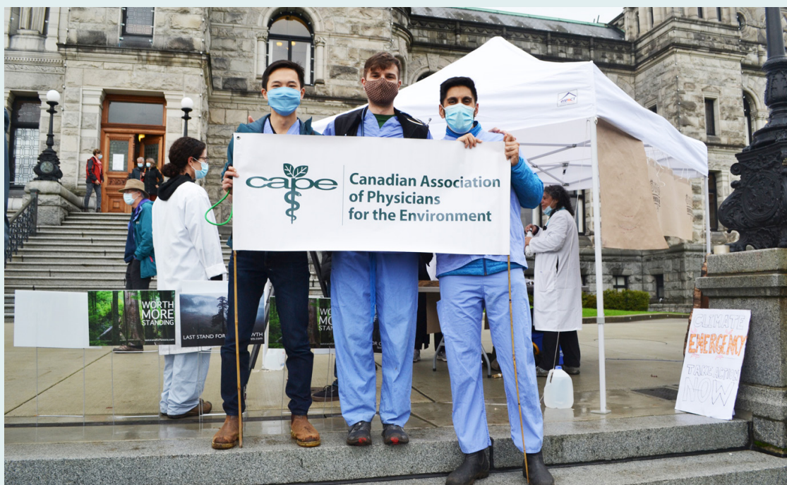
LE RASSEMBLEMENT DES MÉDECINS ET INFIRMIER(ÈRE)S DU 4 NOVEMBRE 2021, DEVANT LES ÉDIFICES DU PARLEMENT DE LA COLOMBIE-BRITANNIQUE.

Fort du savoir-faire de nos membres du conseil d'administration et de nos comités régionaux, l'ACME a lancé en juin 2022 un programme de formation en plaidoyer et mobilisation qui vise à offrir des outils aux professionnel(le)s de la santé pour défendre la santé environnementale partout au pays.